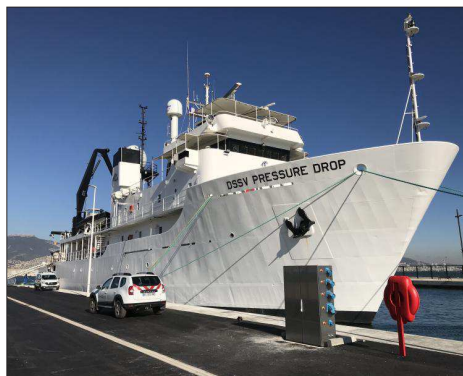
Vendredi, le navire d'exploration sous-marine de 68 mètres du milliardaire américain Victor Vescovo est arrivé à La Seyne. À son bord, un sous-marin biplace.

C'est le texte inscrit sur la plaque de granit, déposée ce week-end sur la Minerve .