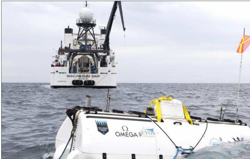
Ce week-end, deux plongées ont été réalisées sur l'épave du sous-marin au sud de Toulon.

À l'origine de cet incroyable épisode, le passage par la rade de l'expédition de Victor Vescovo, un milliardaire américain, qui consacre sa fortune à l'exploration des fonds sous-marins. Passionné par les abysses, il